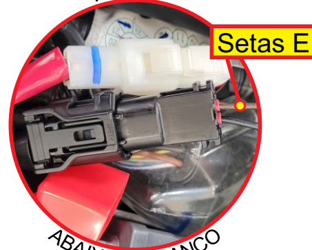
ABAIXO DO BANCO