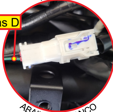
ABAIXO DO BANCO